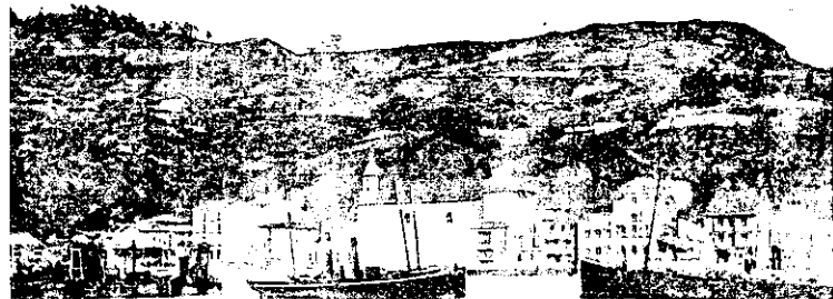
Pasajes.—Vista de Pasajes de San Pedro

Existe una interesante relación del siglo XVI de la costa guipuzcoana, y en especial de Pasajes, en la Descripción y cosmografía de España , de Fer-