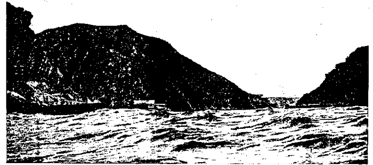
Pasajes.—Entrada del puerto

La instrucción pública la proporcionan los maestros de seis escuelas completas, tres de niños y tres de niñas, debidamente distribuidas. Las