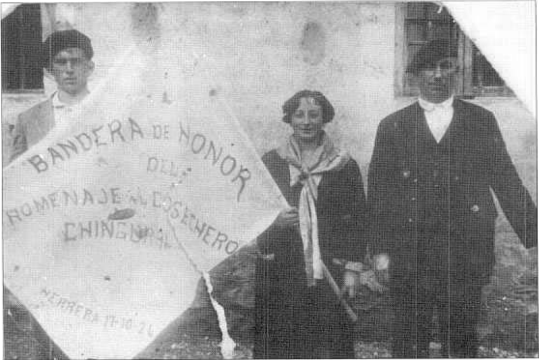
'Fidel Tolaretxipiri egindako omenaldia' 1926. Emailea: Pauli Tolaretxipi.