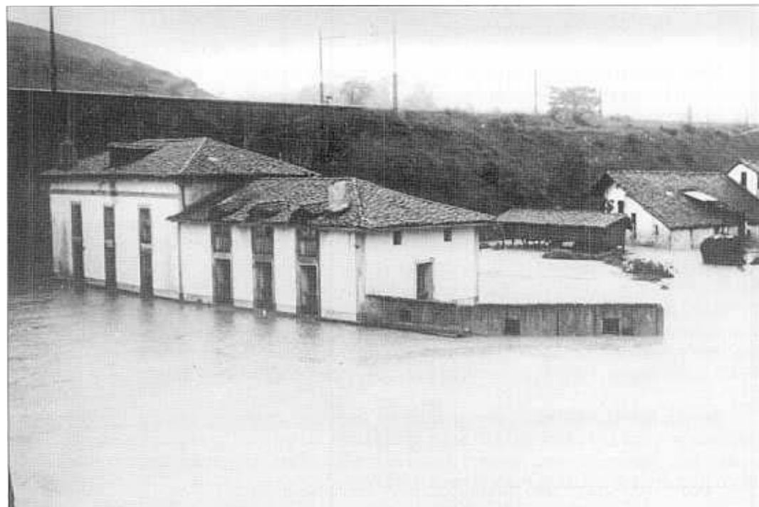
"Uholdeak San Luis Plazan" 1933.