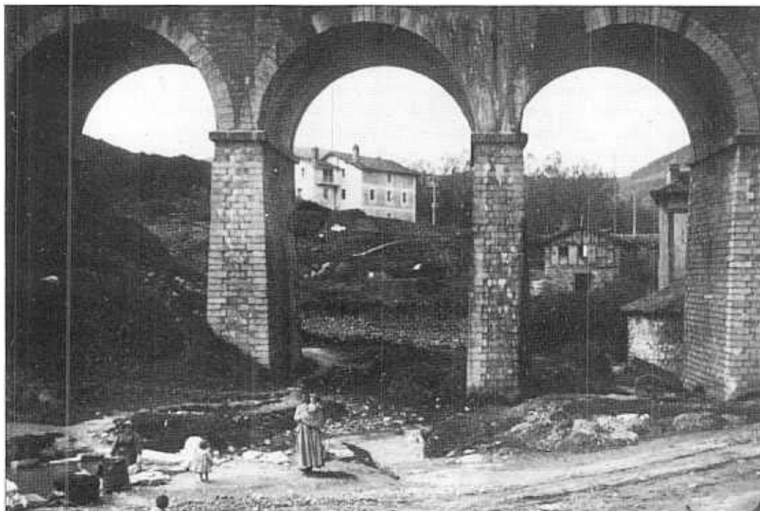
"Herrerako zubia" 1908. Emailea: F. Garin.