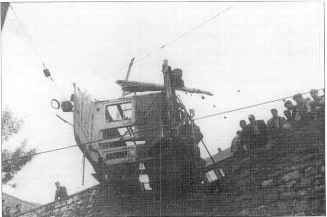
"Tranbiaren istripua" 1947. Emailea: San Luis Parrokia.