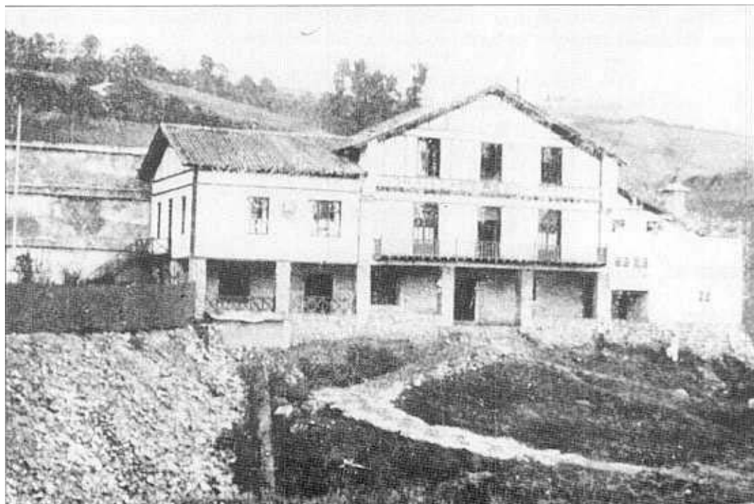
"Jolastokieta" 1917. Emailea: Pikabea Alburna.