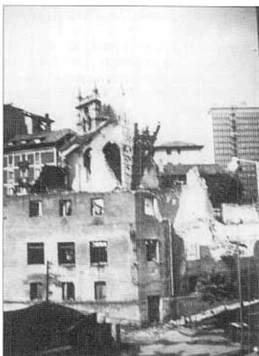
"Eliza bota zuten eguna" 1972