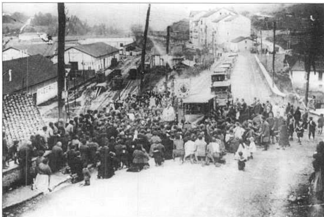
"San Franzisko Xabieren erlikiak". Emailea: San Luis Parrokia.