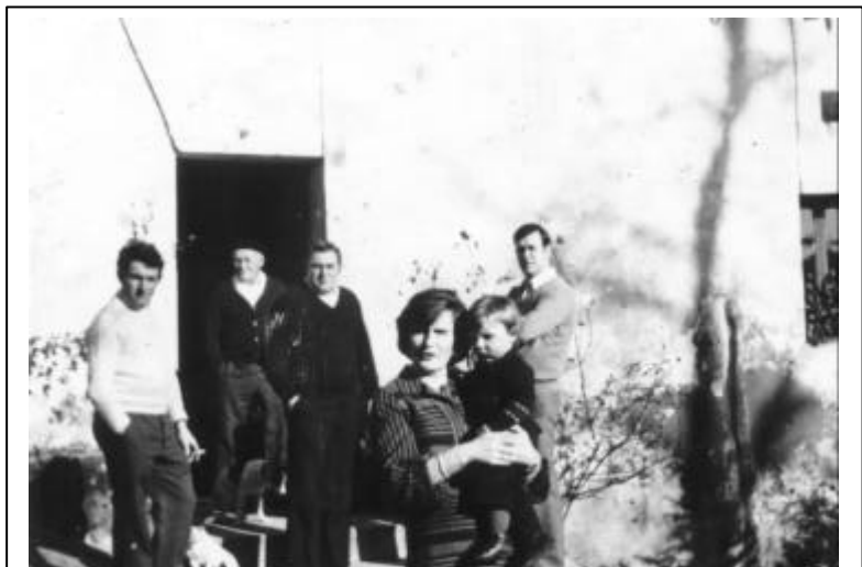
Kastillun baserriko Alkiza familia 1978. urtean

I-122. Aginpidea senar emazteen artean. Eskubide berdinak al dituzte senar-emazteek? Senarraren ahalmenak eta betebeharrak. Emaztearenak.