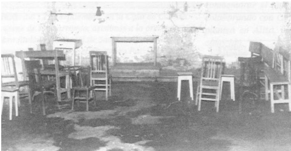
San Pablo Parrokiaren aldarea Casares baserriaren ikuluan.

Podría seguir recordando cosas, pero creo que va siendo hora de volver a la realidad. Termino siendo consciente de que habré dejado muchos más cambios en el tintero...*