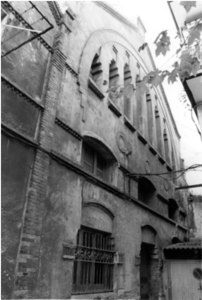
Edificio de la CAMPSA, antigua fábrica de Duelas Llusca (Buenavista)