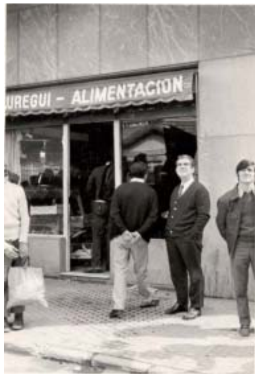
En el cruce de Herrera unos viandantes observan como una grúa retira en volandas el camión Pegaso de Cementos Rezola que se empotró en la tienda de comestibles Jáuregui (6-4-71)

Una de las formas más inteligente de salvaguardar el patrimonio cultural de una comunidad y de recuperar su memoria histórica consiste en establecer vínculos afectivos entre el objeto conservado y el espectador. Uno de los elementos que mejor se presta a este tipo de relaciones es la fotografía, debido a su gran poder de evocación y debido a su capacidad de transportarnos a otros tiempos, transportación tanto más efectiva cuanto se dirija a lugares vividos como propios.