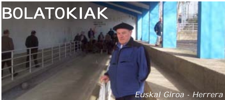
Euskal Giroa - Herrera

Dentro de los deportes al uso, introducidos por esa afición que se ve a nuestro alrededor de imitar el modo de vida USA, resulta más o menos corriente oír hablar de la bolera. Automáticamente nos colocamos ante una instalación que hemos visto en las películas de producción norteamericana. Esta figura, más globalizadora, parece alejar a las nuevas generaciones del bolatoki y, con ello, las distancia de un deporte atractivo, barato y desafiante.